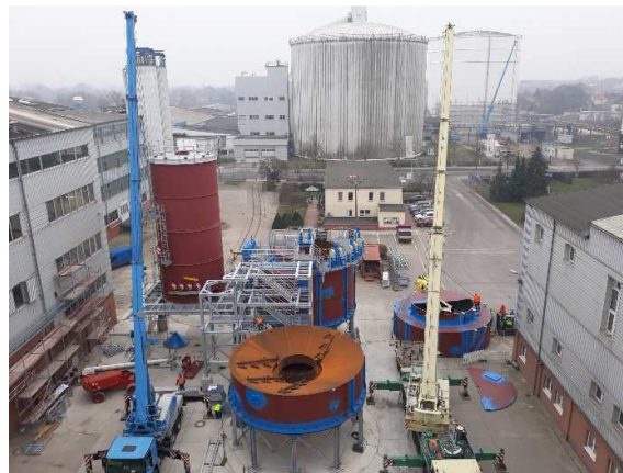
Foto: Baustelle Erweiterung Saffreinigung sowie hinten rechts der neue Dicksafttank 4

neue Dicksafttank 4 mit einem Fassungsvermögen von ca. 80.000 t ist fertiggestellt.