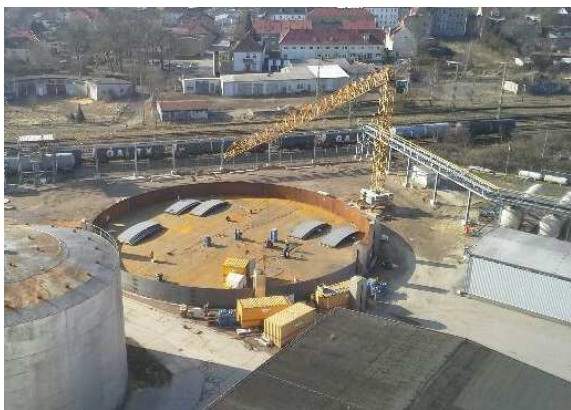
Foto: Baustelle Dicksafttank 4

Nach dem Ende der Verarbeitung laufen bereits die Vorbereitungen für die kommende Dicksaftkampagne, welche Anfang April starten wird. Parallel werden die umfangreichen Baumaßnahmen zur Kapazitätserhöhung fortgesetzt. Dazu zählt u.a. auch ein neuer Dicksafttank, welcher mit einem Volumen von rund 60.000 m 3 in der Nähe der Bahnlinie Berlin-Stralsund gerade entsteht.